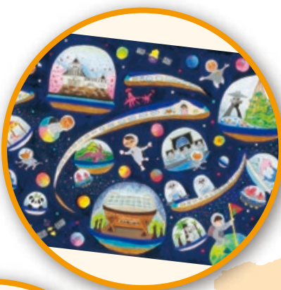
石川県知事賞 4年生